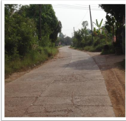
ก่อนดำเนินโครงการ