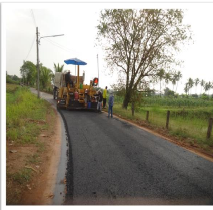
ขณะดำเนินงาน