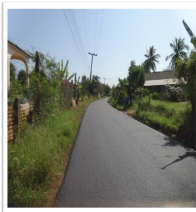
เสร็จสิ้นโครงการ