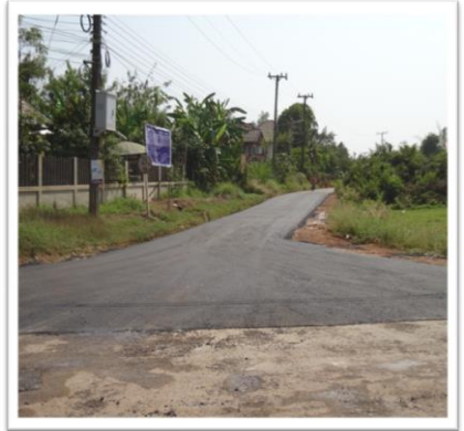
เสร็จสิ้นโครงการ