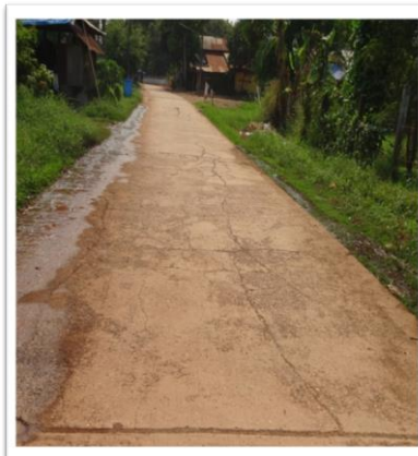
ก่อนดำเนินโครงการ