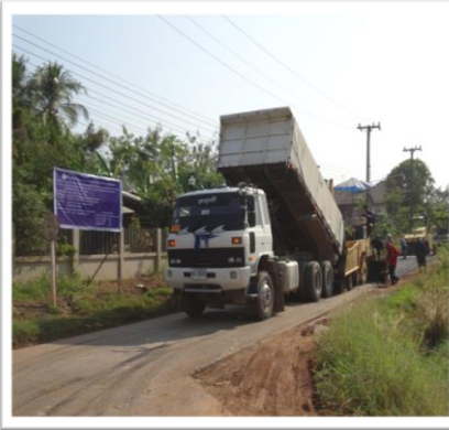
ขณะดำเนินงาน